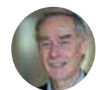
Par ALAIN BOINET, FONDATEUR DE SOLIDARITÉS INTERNATIONALE

Les ODD sont un remarquable outil de progrès humain. Le Forum de Dakar doit les stimuler tout en préparant la voie à la Conférence de l'eau à l'ONU en mars 2023 qui devrait nous doter enfin d'un instrument politique de pilotage et de suivi.