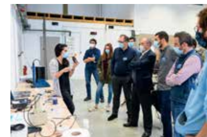
Ateliers EAH 2020 de l'humanitaire

En 2021, le groupe continuera ces dynamiques de concertation, de valorisation de l'expertise et de plaidoyer. Si aujourd'hui les principaux acteurs du groupe sont ceux qui interviennent déjà dans les zones fragiles, l'année à venir sera dédiée à encourager de nombreux autres acteurs français à rejoindre le groupe. Car tous les acteurs du PFE ont des ressources (expertises, finance, RH...) qui peuvent être mobilisées pour soutenir l'atteinte de ces standards minimums et progresser vers l'atteinte de l'ODD 6 pour tous d'ici 2030.