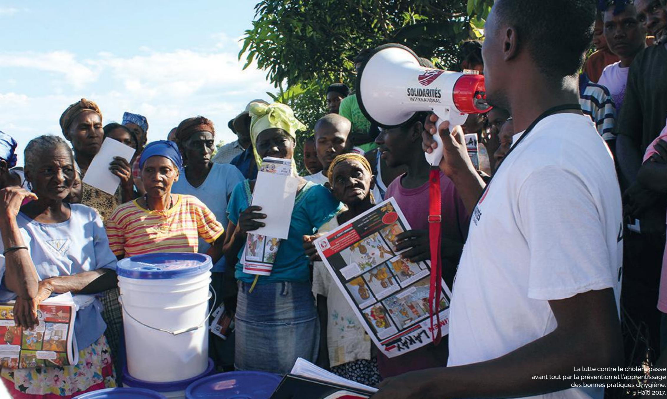
La lutte contre le choléra passe avant tout par la prévention et l'apprentissage des bonnes pratiques d'hygiène. Haïti 2017.