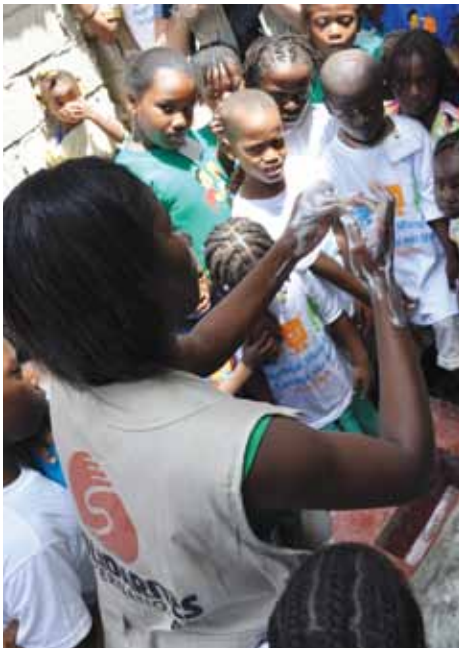
Séance de promotion de l'hygiène

Depuis plus de 30 ans, SOLIDARITÉS INTERNATIONAL intervient après un conflit ou une catastrophe naturelle pour apporter une aide d'urgence aux hommes, femmes, filles et garçons. Nous avons mis à profit ce savoir-faire urgentiste à la suite du tremblement de terre et continuons de le développer dans un pays exposé à des crises récurrentes. Pour une réponse d'urgence efficace, nous avons construit notre approche autour des principes d'un continuum urgence-réhabilitation-développement.