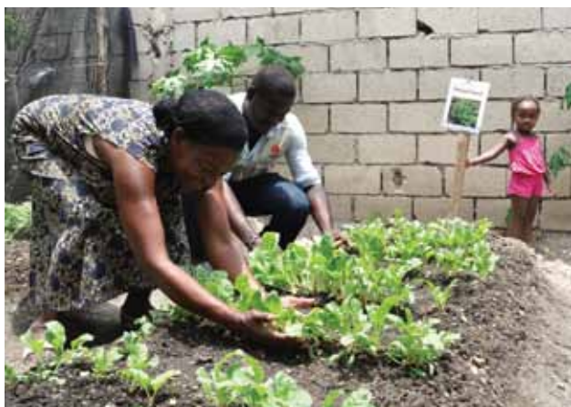
Des pépinières pour alimenter les sacs potagers

Construction de latrines familiales, de réservoirs d'eau potables et campagne de promotion des bons comportements en matière d'hygiène pour prévenir les maladies hydriques.