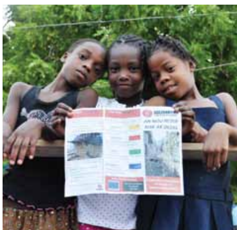
Campagne de préparation aux désastres

SOLIDARITÉS INTERNATIONAL accompagne les populations à identifier leurs besoins prioritaires afin d'aboutir à la définition d'un plan d'aménagement urbain participatif qui intégrera la ravine comme élément structurant du quartier. À l'issue de ce travail de réflexion SOLIDARITÉS INTERNATIONAL accompagne les communautés pour mettre en œuvre les solutions adaptées à leur quartier, dans ses principaux domaines d'expertise. Notre intervention s'inscrit dans une action globale de reconstruction et s'effectue donc dans une logique de partenariat avec tous les acteurs pertinents.