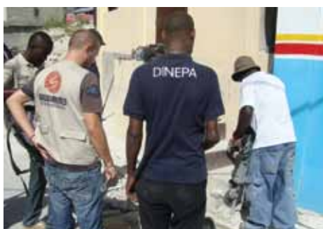
Travail avec les autorités compétentes pour l'amélioration du réseau d'eau