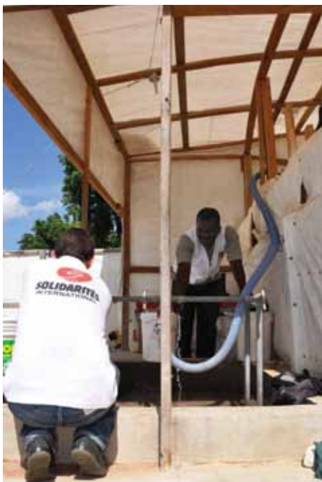
Approvisionnement en eau d'un Centre de Traitement du Choléra

En réponse aux impacts du séisme, nos équipes sont intervenues dans 46 sites de déplacés pour permettre à 70 000 personnes d'accéder à de l'eau potable et à des solutions d'assainissement, avec l'objectif de limiter la propagation des maladies hydriques : distribution d'eau potable via des réservoirs souples, réhabilitation et construction de points d'eau, de latrines, de douches et de lave-mains, construction de fosses à ordures, collecte des déchets, campagne de nettoyage, distribution de kits de gestion de déchets, promotion de l'hygiène.