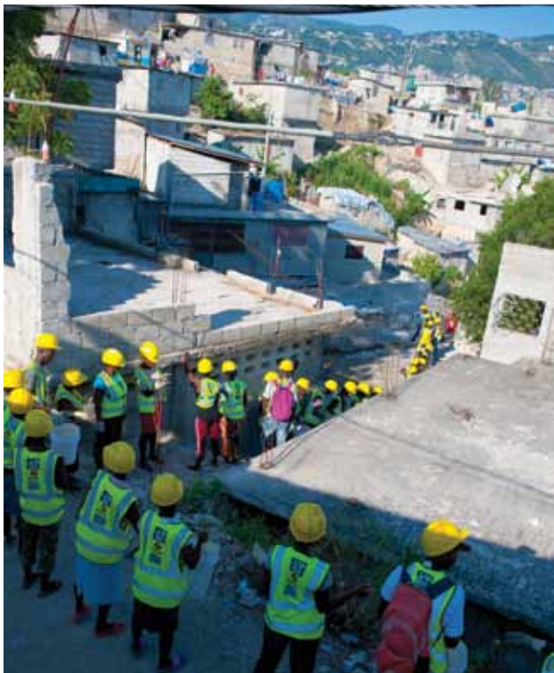
Programme de déblaiement

Le constat est partagé par tous : les conditions de vie de dizaines de milliers de familles dans les camps ne sont pas acceptables. Depuis fin 2010, SOLIDARITÉS INTERNATIONAL développe et met en œuvre un programme global d'accompagnement des personnes vivant dans les camps afin de faciliter leur réinstallation dans leur quartier. Nous avons conçu cette approche autour de deux axes : à l'échelle urbaine, nous travaillons à rendre les quartiers plus sains, plus sûrs et donc plus attractifs. À l'échelle humaine, nous accompagnons les familles vivant dans les camps à se doter des moyens nécessaires pour pouvoir quitter leurs abris de fortune et repartir s'installer dans leur quartier d'origine.