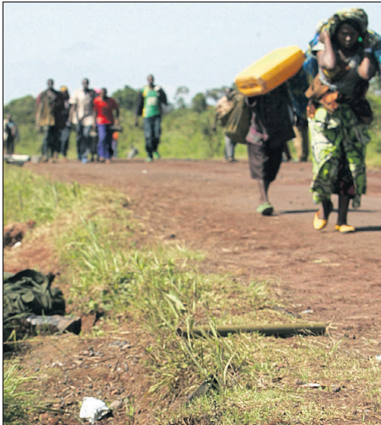
KIBUMBA (REPUBLIQUE DEMOCRATIQUE DU CONGO), HIER. Les civils fuient les violents combats qui secouent le nord-est du pays.

L E CHEF de la diplomatie française, Bernard Kouchner, et son homologue britannique, David Miliband, sont partis hier soir pour Kinshasa et Goma, en République démocratique du Congo (RDC), puis se rendront ensuite à Kigali, au Rwanda, dans le but de faire pression sur les principaux acteurs régionaux de la crise au Kivu et tenter ainsi d'éviter une nouvelle catastrophe humanitaire dans la région des grands lacs. Accompagné du secrétaire d'Etat français à la Coopération, Alain Joyandet, Kouchner doit également tenter d'évaluer les besoins humanitaires au Nord-Kivu, où des dizaines de milliers de civils ont été jetés sur les routes par les combats. « C'est un massacre comme il n'y en a proba-